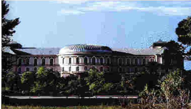
تصویر ۹: قصر دارالامان، مظهری از هویت ملی، آزادی و دیموکراسی و پیشرفت عصر فرخنده‌ی امانی قبل از تخریب.

سنگرهای جنگ تبدیل شده درختان آن از بین رفت. به گونه‌ی مثال درختان دو طرفه‌ی سرک دارالامان را که در عصر امانی در چهار رسته غرس شده بودند و درختان باغ قصر دارالامان را، به بهانه‌ی اینکه مجاهدین خود را در عقب آنها ستر و اخفا می‌کنند، از بین بردند. با همین بهانه درخت‌های دو طرفه‌ی سرک کابل - پروان را از بیخ و بن قطع کردند. علاوه بر این هزاران درخت نیله باغ، آن جنگل باغ قدیمی و زیبا را، که در چهاردهی کابل به موازات سرک دارالامان موقعیت داشت، از بین بردند. مضاف بر این، پلان انکشاف شهری را دو دسته به ارباب روسی تقدیم کرده و شهر را به منظور کسب موفقیت در جنگ، از اساس دگرگون ساختند. آنگاه پرچمیهای خیانتکار در یک کودتا، کابل عزیز را دزدانه به دست برادران رضاعی اخوانی خود سپردند تا دمار از جان آن شهر نازنین بر آرند (تصاویر ۸، ۱۰ و ۱۱).