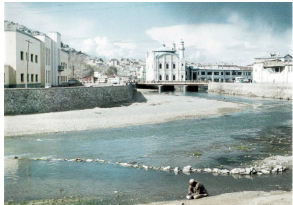
تصویر ۱۲ : هدایت آب دریای کابل به باغ های داخل شهر، ۱۹۶۷.

از منطقه پل محمود خان جویی به سمت شش درک کشیده شده بود. احتمال دارد که این منطقه به خاطر آن به این نام مسما شده باشد که این جوی در آن محل به شش بخش (درک) تقسیم می شده است. جویهایی که از دریای کابل منبع می گرفتند، سراسر کابل را به باغستانها، تاکستانها و مزارع سبز و شاداب تبدیل کرده بودند.