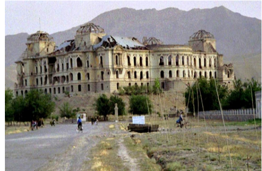
تصویر ۸: قصر دارالامان که بر اثر جنگهای احزاب اسلامی تخریب گردید.