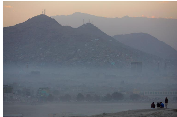
تصویر ۱۹: دود، گرد و گازات مضر در هوای خفه کننده کابل، تصویر ۲۰: کریکت بازیکنان در خاکباد های روزمره کابل، سال ۲۰۰۷ [۴].

هوای دود آلود کابل با گرد و خاکباد آن چنان غلیظ است که نفس انسان را در سینه اش خفه می سازد و موجب سرفه شدیدی می گردد که به نام "سرفه کابل" مشهور شده [۴]. بیشتر از ۷۰ درصد مریضی های کابل از هوای کثیف، فضله آب ها و فضلات نشأت می کند که در نتیجه امراض سرطانی پیدا شده که به خصوص از کودکان قربانی می گیرند. خارجی هائی که در کابل زندگی می کنند ماهانه یک بار به دوبی می روند تا از مشقات کابل گریخته، استراحت و تجدید قوت کنند [۴]. علاوه بر این همه روزه مناطق سبز شهر از بین می روند و در جای آنها تعمیرات بد منظری قد بر می افزایند. از مناطق سبز شیر پور، بی بی مهرو، وزیر آباد، شیوه کی و چهاردهی کمتر اثری باقی مانده است. در سایر کشورها معمول است که منازل مسکونی را در دامنه کوهها و بلندیها می سازند و ساحات پایین افتاده را سبز نگه می دارند تا از یک طرف نمای شهر حفظ گردد و از جانب دیگر هوای شهر پاک ماند. ولی معلوم نیست که در ملک ما چرا همه چیز باید سر چپه باشد.