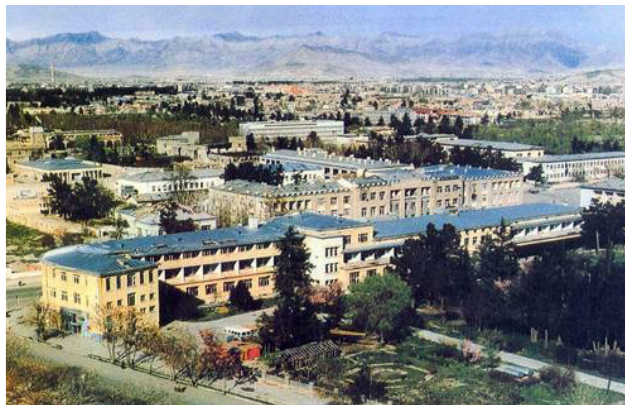
تصویر ۱۸ : هوای ستره کابل که تا قبل از تجاوز شوروی سابق در افغانستان از کنار تا کنار آن به روشنی معلوم می شد [۴].

با شرحی که از سیستم آبیاری در بالا رفت، روشن می گردد که سراسر حوزه کابل در طول صد ها سال سبز و خرم و شاداب و پر طراوت بود. "کابل با پارک های سبز و گل و گلزار فراوانش که در همه جا دیده می شد و با آسمان نیلگون و اشعه زرین خورشیدش در دهه ۱۹۶۰ در جمله زیباترین شهر های جهان حساب می شد" [۴]. این شادابی و سرسبزی و هوای پاک و روشن حتی شامل مناطق مزدحم مرکز شهر هم می گردید (تصاویر ۱۷ و ۱۸).