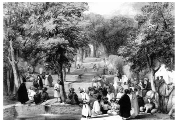
Babur's Garden, central axis, 1842