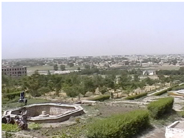
تصویر ۷ : باغ بابر، نگاه از شرق به طرف غرب، ۲۰۰۶.