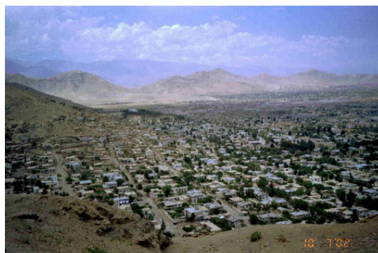
تصویر ۴: گوشه بخش شرقی حوزه فرو افتاده کابل. مناطق کارته پروان و خیر خانه. تابستان ۲۰۰۲.