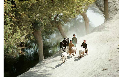
تصویر ۱۴ : جوی با درختان توت در منطقه سهاک، نزدیک شیوه کی، کابل.

از همینروست که اکثریت جویهای کابل با درختان توت مزین می بودند و از بسیاری درختان دیگر عمر بیشتر می کنند، زیرا تا زمانی که درختان کهنسال توت فرسوده نشوند، کسی جرأت قطع کردن آنها را نمی داشت. در بسیاری جا ها درخت توت را مقدس دانسته گاهگاهی در جوار درختان بزرگ توت زیارتی ساخته در پای آن شمع می افروختند. از همینروست که بعضی محله ها به نام این نبات پیوند خورده است، چون محل "یکه توت"، "درخت توت"، "بیگ توت"، "شاه توت" و غیره. ولی متأسفانه که این فرهنگ گهر بار مردم هم مانند بسیاری داشته های دیگر فرهنگی جامعه ضربت کاری خورده و در بعضی جاها نه از توت نشان مانده و نه هم از توتنشان و نه هم از پیوندگر توت.