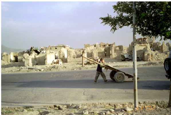
تصویر ۱۱: مناطق تخریب شده شهر کابل توسط احزاب اسلامی که در بعضی از آنها مردم زندگی می‌کنند.