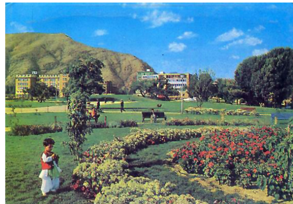
تصویر ۱۷ : پارک سرسبز و شاداب زرنگار در قلب کابل قبل از تجاوز شوروی سابق در افغانستان [۴].

مناطق سبز دور و بر مرکز کابل از یک جانب هوای شهر را پاک نگه می داشت (تصاویر ۱۷ و ۱۸) و از جانب دیگر ضرورت ترکاری، میوه و غله کابل را رفع می کرد. گذشته از این تعادل آب های رویزمینی و زیرزمینی را برقرار کرده بود و فضلات شهر به شکل طبیعی توسط دهقانان در امور زراعت به کار می رفت. از زمانیکه این سیستم قدیمی به هم خورده و سیستم بهتر از آن هم تعبیه نگردیده، زیبایی های شهر از بین رفته اند. از یک جانب با ازدیاد تعداد نفوس و عراده جات ۷ و عمارات جدید گویا کابل مدرن گردیده، در حالیکه شهر غرق در فضلات، دود و گرد و خاک شده و صحت و سلامت مردم خساره مند گردیده است. از جانب دیگر چون برق کافی در کابل وجود ندارد، بنا برآن هزاران جزئیتر دیزلی شب و روز چالان اند [۴] که دود و ذرات کوچک سمی آن به گرد و خاک هوا چسبیده و به آلودگی آن می افزاید. گذشته از این در خانه ها غرض تسخین چوب و ذغال سوختانده شده و در خشت پزی ها و حمام ها تایر های کهنه موتو و پلاستیک را می سوزانند که در نتیجه هوا بیشتر غلیظ می گردد [۴]. تحقیقاتی که در مورد، گرد و خاکی که در فضای کابل از سالها به این طرف در چرخ است، صورت گرفته، نشان می دهد که بیشتر آن دود و خاکستر و