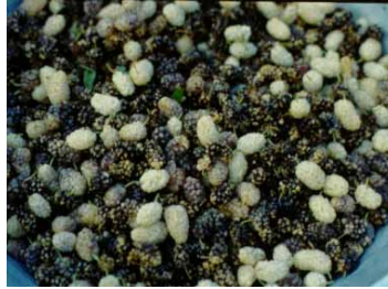
تصویر ۱۵ : هم نشاندن درخت توت و هم خوردن میوه آن ثواب دارد.