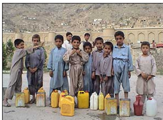
تصویر ۱: کودکان منتظر آب در نزدیکی باغ بابر در کابل، ۲۰۰۷.

و اما مشکلات کمبود آب کابل علل گوناگون دارد. به طور مثال در طول سه دهه جنگ پلانهای برای تأمین آب به منظور زراعت، صنعت و نوشیدن روی دست گرفته نشده و بر منابع محدود آب کابل هنوز بی رحمانه دستبرد زده می شود و دولت ضد مردمی تماشاگر بی غرض این صحنه های دلخراش است. از جانب دیگر نفوس کابل در اثر جنگ و عودت مهاجران از خارج کشور، به طور سرسام آور بلند رفته چنانکه در سال ۲۰۰۸ تعداد باشندگان کابل در حدود ۴،۷ میلیون نفر رسیده است و تا سال ۲۰۱۰ تا حدود ۵ میلیون نفر خواهد رسید، در حالیکه قبل از تجاوز شوروی کمی بیشتر از نیم میلیون نفر بود (دیگرام ۱).