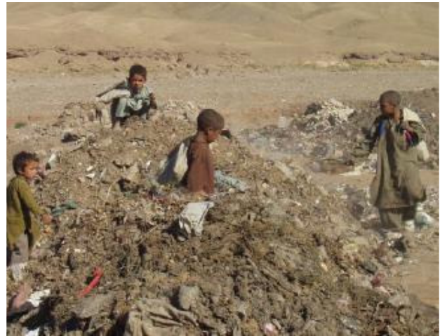
تصویر ۲: کودکان در حال جست و جو در زباله های شهر کابل. تصویر ۳: نوجوانان در حال جست و جو در زباله های شهر کابل.

چنانکه قبلاً تذکر یافت، نفوس کابل به سرعت افزایش می یابد و این در حالیست که ساحة شهر بدون کنترل در حال توسعه است که خود مشکلات بیشتر بالخاصه در جهت تأمین آب نوشیدنی خلق می کند. همچنین سطح آب دریاها و آبهای زیر زمینی بسیار پایین افتاده، بیشتر از ۸۰ درصد چاه های کابل تا سالهای ۲۰۰۵ خشک گردیده و مردم کابل با مشکل شدید کمبود آب مواجه اند که بار این مشکلات نه بر دوش مسئولین دولت، تجار و سرمایه دار، بلکه بر دوش زنان و کودکان فقیر کشور سنگینی می کند (تصویر ۱).