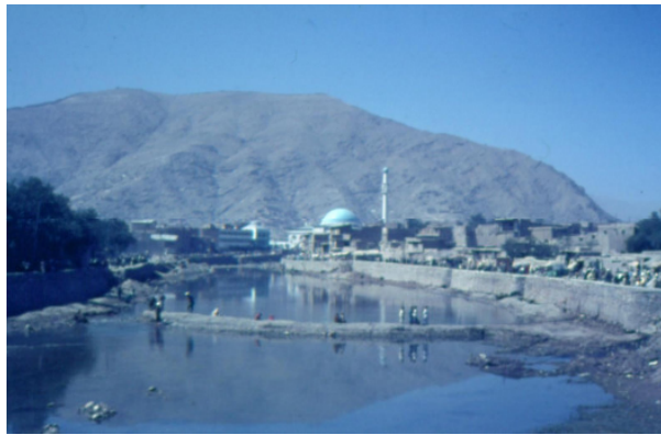
تصویر ۱۳ : هدایت آب دریای کابل به دور و نواح شهر، ۲۰۰۷.

می کردند. در منطقه اندرابی بندی در بستر دریا بسته می شد که به نام بند ناظر صفر ۶ یاد می گردید و تا نواحی بی بی مهر، کلپ عسکری و میدان هوایی آب می رساند (تصاویر ۱۲ و ۱۳).