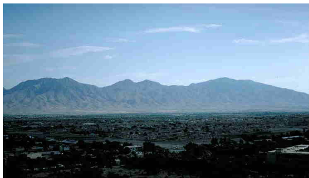
تصویر ۵: نواحی از بخش غربی حوزه فرو افتاده کابل. مناطق غرب چهاردهی که قبل از جنگ سر سبز و شاداب بود.

حوزه فرو افتاده کابل توسط کوه های شیردروازه، آسمایی و علی آباد به دو بخش تقسیم میشود. سمت شرق این حوزه شامل شهر کهنه و شهر نو کابل گردیده و تا مناطق کارته پروان، خیر خانه، شش درک، بگرامی، پلچرخ، میدان هوایی کابل و اطراف آن و دامنه های کوه صافی میرسد. سمت غرب این حوزه از مناطق گلپاغ شروع شده، ساحه چهاردهی را احتوا نموده تا پغمان و دور و بر گذرگاه و دهمزنگ می رسد (تصاویر ۴ و ۵).