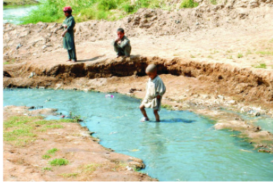
تصویر ۱۶ : جویهای بی درخت ساحه را تخریب کرده تبخیر را زیاد می کنند.